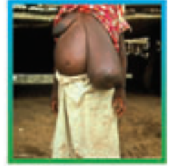
एकै दिनको उपचारले तपाईंलाई हात्तीपाइले रोग हुनबाट रक्षा गर्दछ ।

यो रोग तपाईं तथा जुनसुकै उमेरको व्यक्तिलाई पनि हुन सक्छ ।