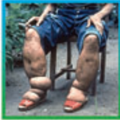
हात्तीपाइले रोग समयमा उपचार भएमा निको हुने रोग हो । यसको लागि नि:शुल्क औषधि उपलब्ध छ ।